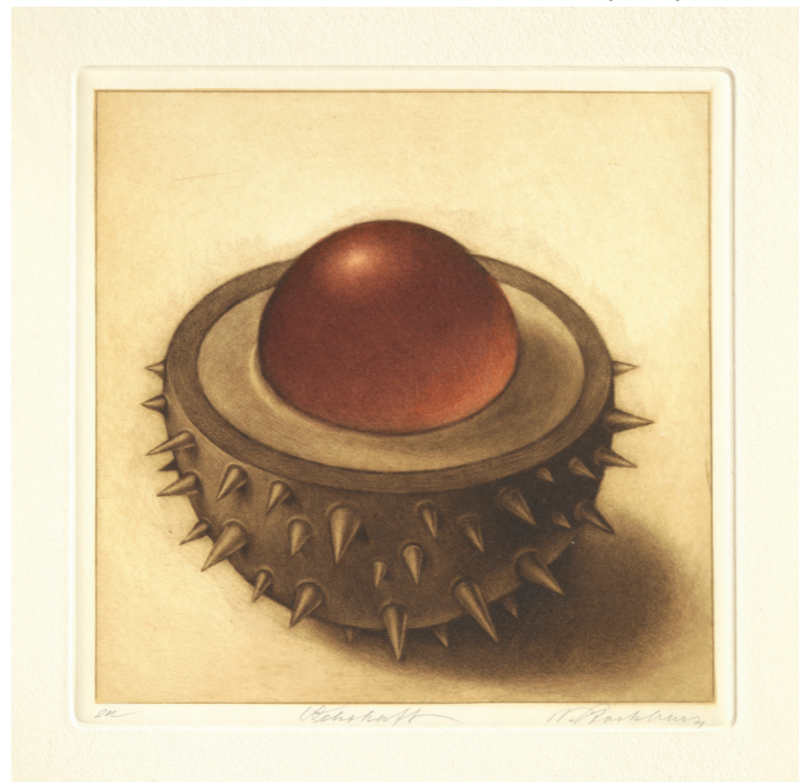
Wehrhaft, 2021, 20 x 20 cm