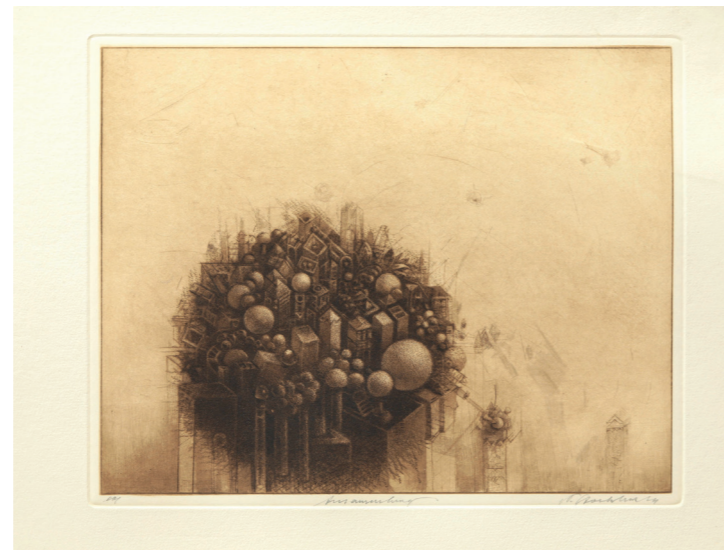
Ansammlung, 2015, 20 x 25 cm

Stiftung der Kreissparkasse Rottweil für Kunst, Kultur und Denkmalpflege