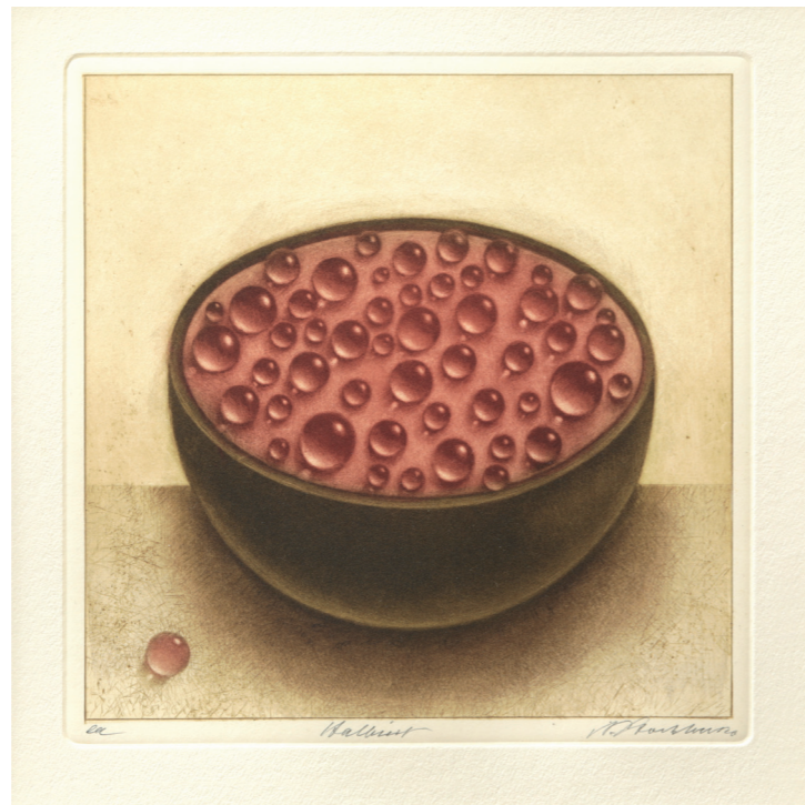
Halbiert, 2020, 20 x 20 cm